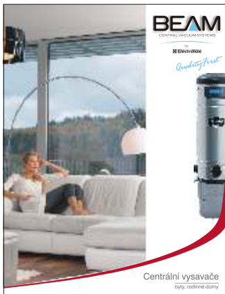
Byty, rodinné domy